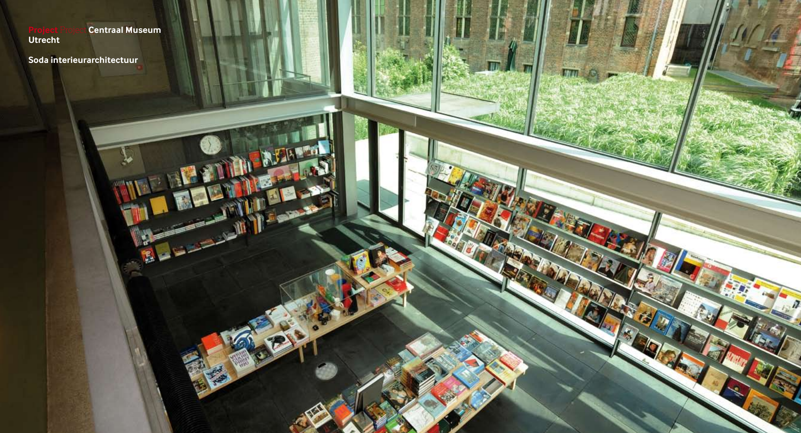
Bij binnenkomst is de eerste ingreep van Soda te zien: de winkel en de entree.

Arriving at the museum, you see Soda's first intervention: the shop and the entrance hall.