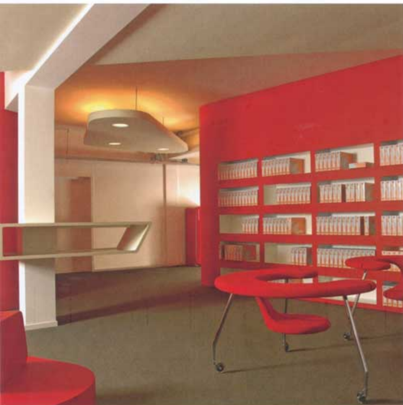
Kantoor TFC Trainings-Media, Velp

Soda werd opgericht in 2000. Veel bekendheid kreeg het bureau