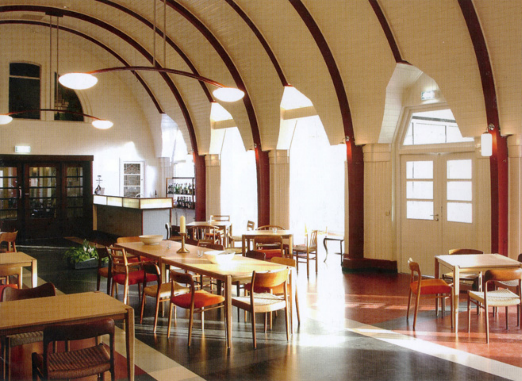
De Zwanenhof, Zenderen