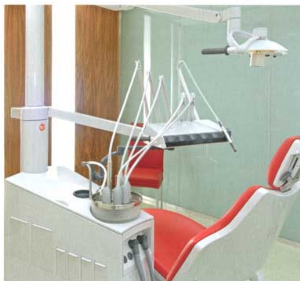
Tandartsenpraktijk Zaandam, 2006. De slingerende wand brengt licht en dynamiek in de lange L-vormige ruimte.